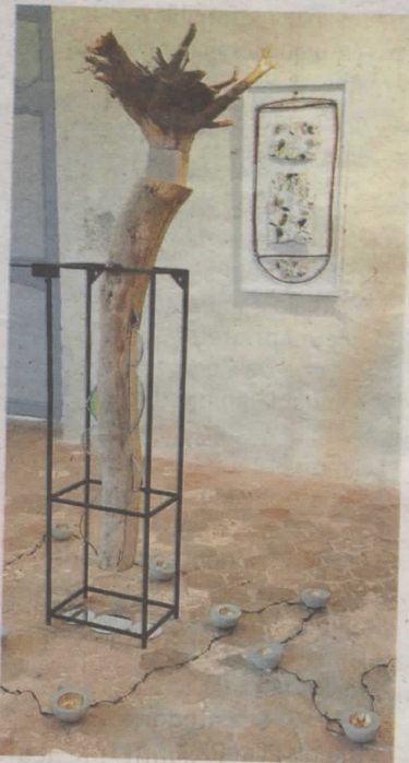
"Autre hêtre d'autrefois".